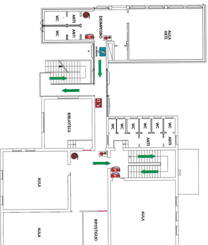
PUNTO DI RACCOLTA